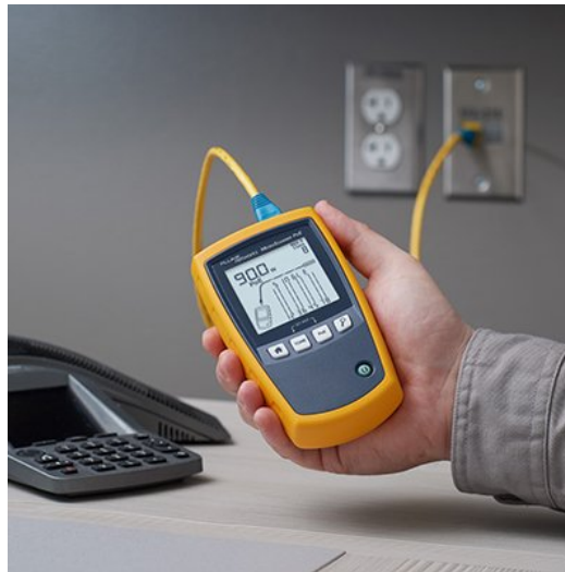
Abbildung 5. The MicroScanner PoE is Ethernet Alliance Gen2 PoE certified and can detect the power offered by the PSE plus the network's speed, and features a suite of cable testing features.

Wählen Sie das richtige Gerät aus, zertifizieren Sie die Leistungsfähigkeit des Kabels und stellen Sie dann sicher, dass Ihr Techniker die Installation prüfen und Fehler beheben kann. Dann kann das PoE-Projekt problemlos ausgeführt werden.