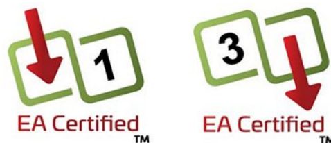
Abbildung 3. Ethernet Alliance-Markierungen für versorgte Geräte (links) und Geräte für die Spannungsversorgung (rechts)

Netzwerkplaner oder Installateure von PoE-Geräten können einfach die Markierungen auf dem PSE und dem PD vergleichen, um die Kompatibilität zu ermitteln. Wenn die Einstufung des PSE mindestens den Anforderungen des PD entspricht, ist die Funktionalität gewährleistet.